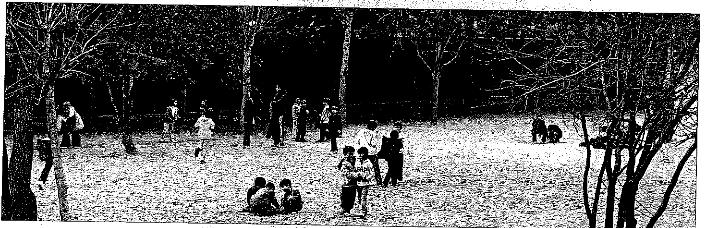
COLEGIO LICEO EUROPEO DE MADRID

El Castillo y Ciudadcampo, de la Institución SEK, pertenecen a uno de los grupos más avanzados de enseñanza privada, laica y mixta de España. Su leit motiv es Educar en libertad para la libertad , una idea que resume su proyecto académico. En él, los alumnos planifican y realizan su propio trabajo para despertar sus aptitudes y promover la creatividad, reflexión y el espíritu de superación. En Educación Infantil y Primaria, el 50% de las asignaturas se imparten en lengua inglesa, mientras que también existe la posibilidad de cursar los programas Años Intermedios y Bachillerato Internacional. Puntuación: Total: 90/100. Grupo A: 35/39. Grupo B: 29/34. Grupo C: 26/27.