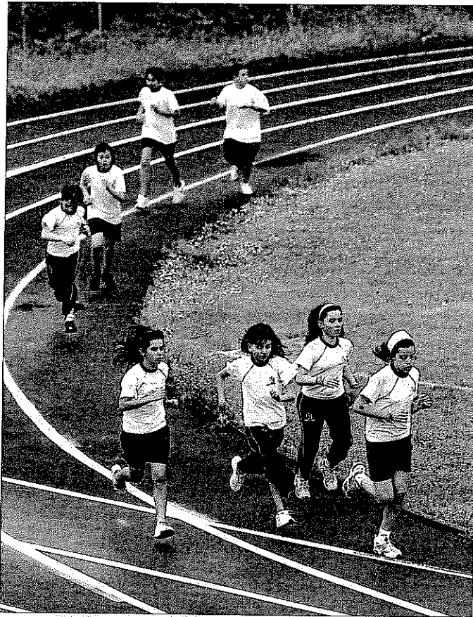
COLEGIO VIZCAYA DE VIZCAYA

PUNTAJACIÓN: Total: 91/100. Grupo A: 34/39. Grupo B: 32/34. Grupo C: 25/27.